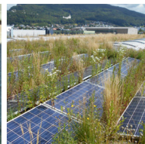
Periodischer Service Vorsorgliche Pflege des Daches