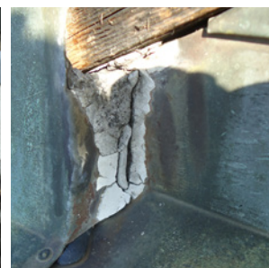
Erstservice Notwendig innert Jahresfrist