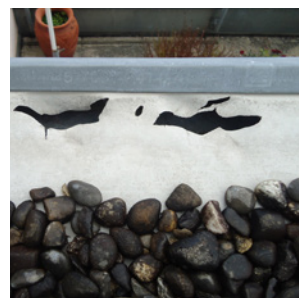
Sofortmassnahmen Notwendig und dringend empfohlen

Dank unserer langjährigen Erfahrung sehen wir auf den ersten Blick, was nötig ist. Wir teilen die Massnahmen in folgende Dringlichkeitsstufen ein: